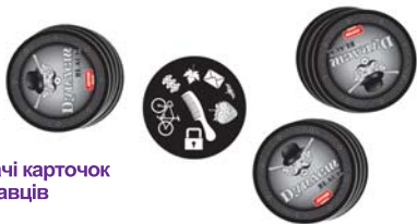
Приклад роздачі карточок на 3-х гравців

Підготовка до гри. Ретельно перетасуйте колоду карт. Почніть роздачу усіх карток між гравцями (по одній) сорочкою вгору, починаючи з найстаршого учасника. Останню карточку покладіть посеред столу у відкриту.