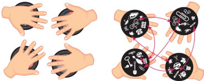
Приклад роздачі карточок на 4-х гравців

Підготовка до гри. Цей варіант гри проходить у декілька раундів. Після перетасовки колоди, гравці отримують по одній карточці. Решта карточок відкладаються в сторону до наступних раундів. Кожен учасник кладе свою карточку собі у долоню (див. мал.).