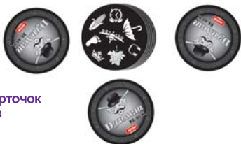
Приклад роздачі карточок на 3-х гравців

Підготовка до гри. Ретельно перетасуйте колоду карт. Роздайте кожному учаснику по одній карточці сорочкою вверх, решту – покладіть стопкою по центру столу у відкриту.